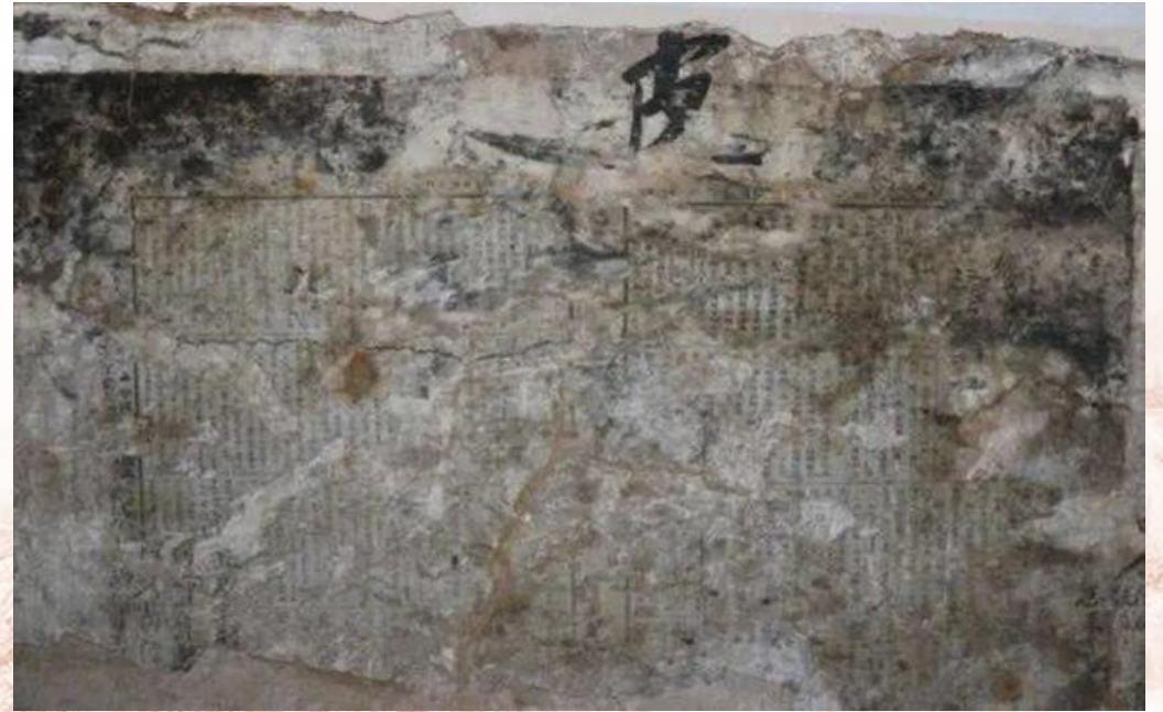
红四军政治部编印的《浪花》创刊号

《浪花》很快成为当时红四军宣传战绩、发动群众、揭露和打击敌人的有力武器，它作为现存正式出版的最早的人民军队铅印军报，在党的新闻报刊史上具有划时代的意义。