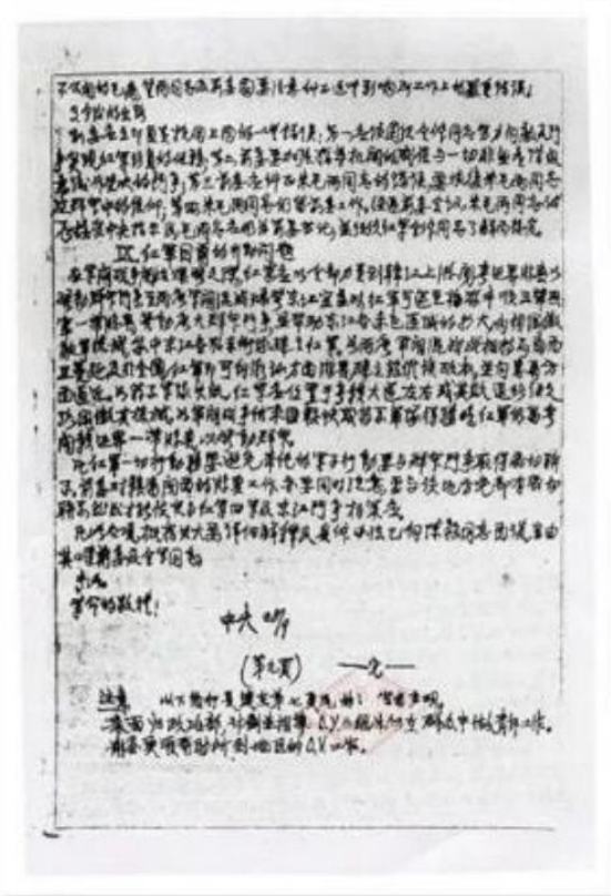
1929年中央“九月来信”（抄件）